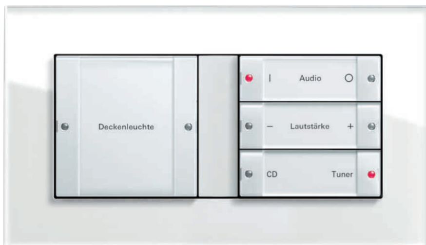
Tastsensor 2, 4fach zur Steuerung der Instabus KNX/EIB-Funktionen und des KNX/EIB Audio-Systems, Gira Esprit, Glas Weiß