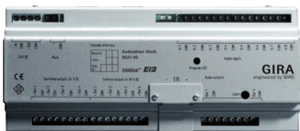
Instabus Audioaktor 4fach

Weitere Informationen erhalten Sie im Gira Katalog sowie im Internet unter www.gira.de