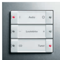
Tastsensor 2, 3fach zur Steuerung des KNX/EIB Audio-Systems Gira E2, Farbe Alu