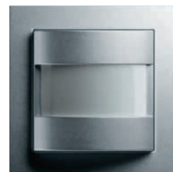
Instabus IR Umsetzer Gira E2, Farbe Alu