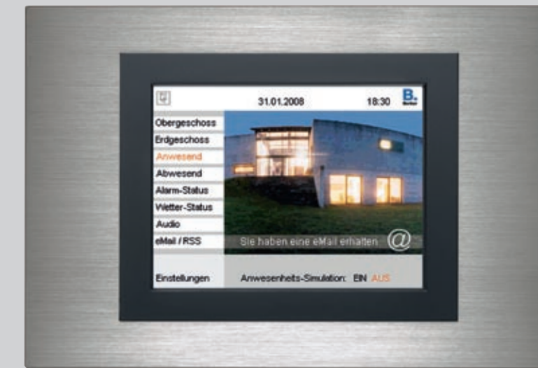
Berker Master Control