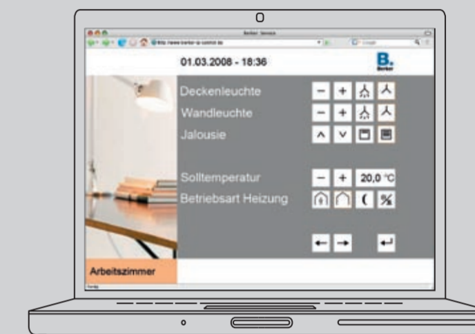
Berker IP-Control - Gebäudesteuerung via PC